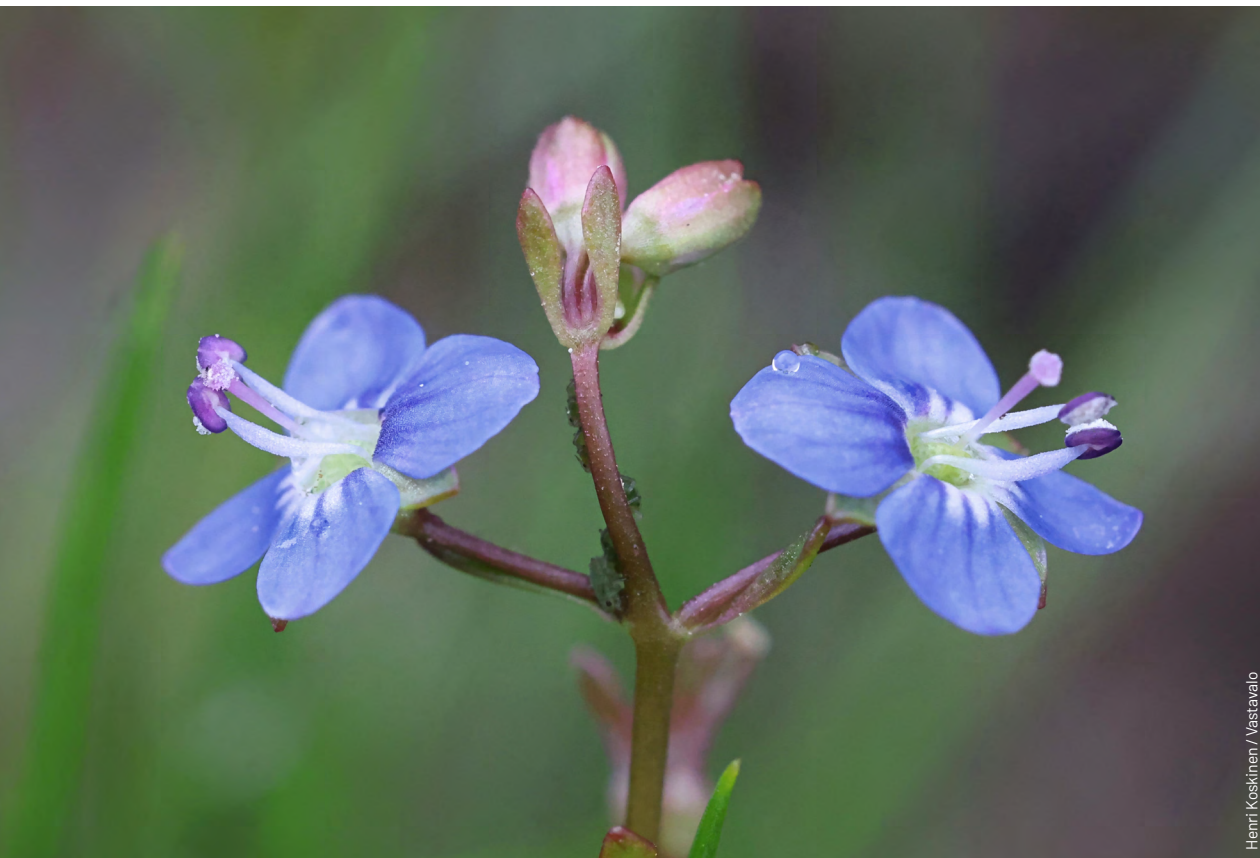
Henri Koskinen / Vastavalo