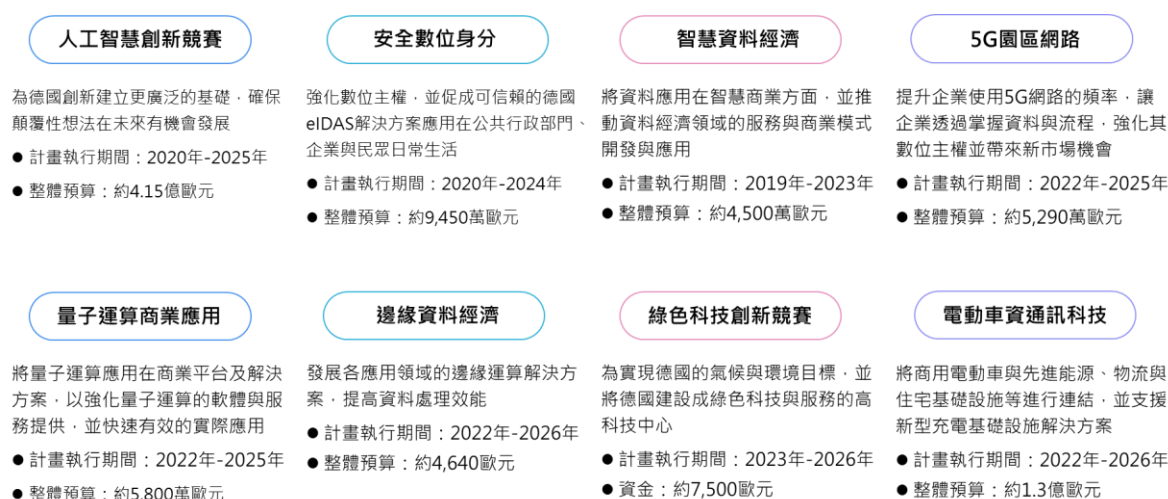
圖一、德國數位科技計畫

為因應當前科技趨勢與市場需求，並應對各項社會挑戰，BMWK 已啟動的科技計畫範圍廣泛，涵蓋數位轉型的各個面向，如人工智慧創新、數位身分、資料經濟、量子運算、5G 網路、綠色科技與資通訊科技等，如圖一。